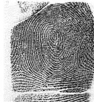
Eskuin Eratzun hatza / 4 Anular derecho