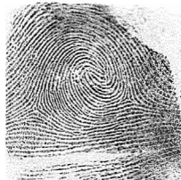
Esk. Hatz erakustea / 2 Indice derecho