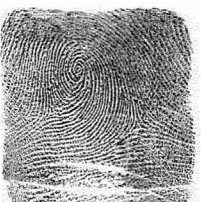
Esker Erdiko hatza / 8 Medio izquierdo