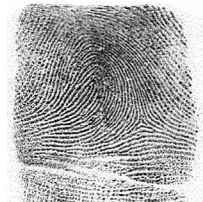
Esker Hatz erakustea / 7 Indice izquierdo