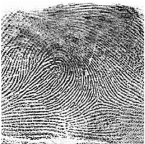
Ezker Erpuru / 6 Pulgar izquierdo