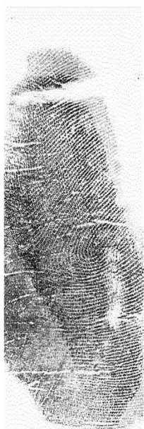
Ezkerreko ertz hipotenarra Borde hipotenar izquierdo