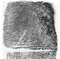
Esker Hatz bikia / 5 Meñique derecho