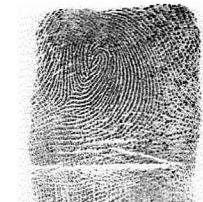
Esker Hatz bikia / 10 Meñique izquierdo