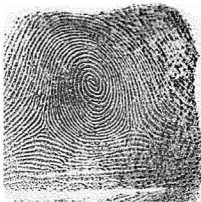
Esker Erdiko hatza / 3 Medio derecho