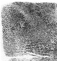
Esker Eratzun hatza / 9 Anular izquierdo