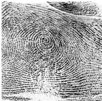
Eskuin Erpuru / 1 Pulgar derecho