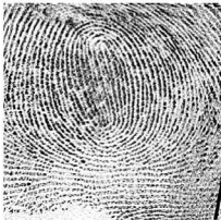
Eskuin Erpuru / 1 Pulgar derecho