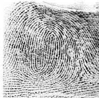
Esk. Hatz erakustea / 2 Indice derecho