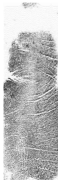
Eskuineko ertz hipotenarra Borde hipotenar derecho