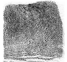
Esk Hatz bikia / 5 Meñique derecho