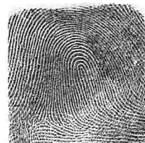
Eskuin Eratzun hatza / 4 Anular derecho