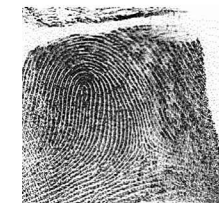
Ezker Hatz bikia / 10 Meñique izquierdo