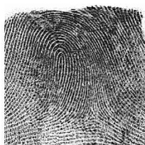
Ezker Eratzun hatza / 9 Anular izquierdo