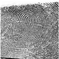
Ezker Erpuru / 6 Pulgar izquierdo