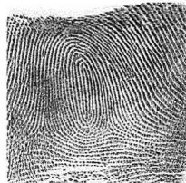
Esk Erdiko hatza / 3 Medio derecho