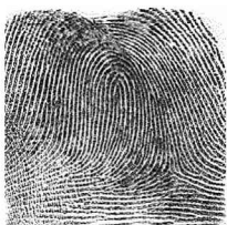
Ezker Erdiko hatza / 8 Medio izquierdo