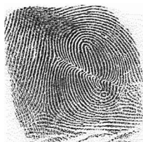
Ezker Hatz erakustea / 7 Indice izquierdo