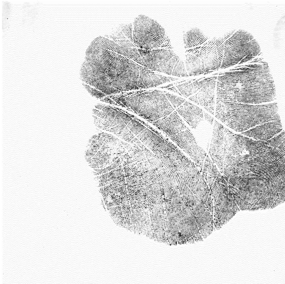
Eskuineko ahurra / Palma derecha