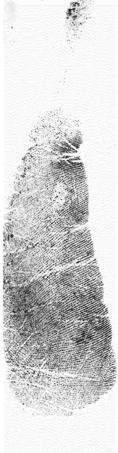
Ezkerreko ertz hipotenarra Borde hipotenar izquierdo