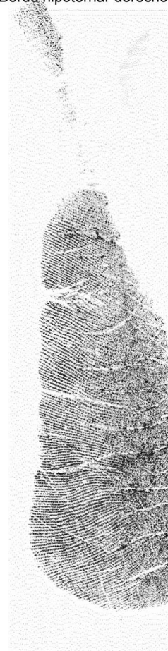
Eskuineko ertz hipotenarra Borde hipotenar derecho