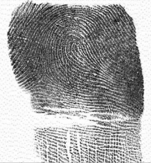
Esk Hatz txikia / 5 Meñique derecho