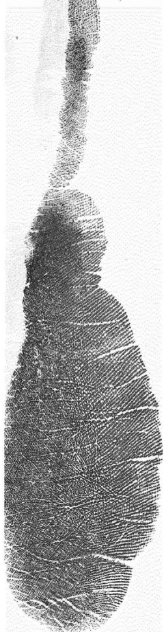
Ezkerreko ertz hipotenarra Borde hipoternar izquierdio