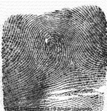
Ezker Eratzun hatza / 4 Anular izquierdo