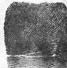
Eskuin Eratzun hatza / 4 Anular derecho