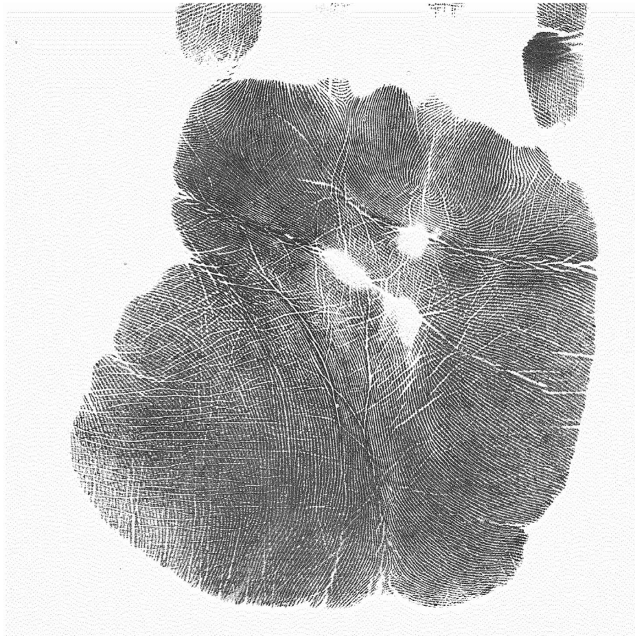
Eskuineko ahurra / Palma derecha