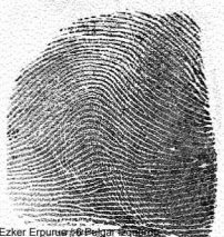
Ezker Erpuru / 1 Pulgar izquierdo