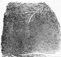
Eskuin Erpuru / 1 Pulgar derecho