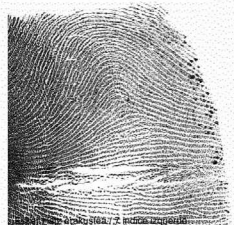
Ezker Hatz erakustea / 2 Indice izquierdo