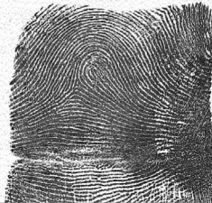
Esk Erdiko hatza / 3 Medio derecho