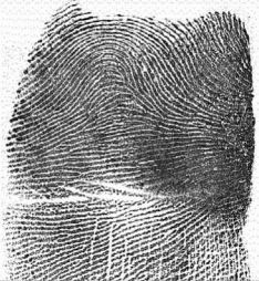
Esk. Hatz erakustea / 2 Indice derecho