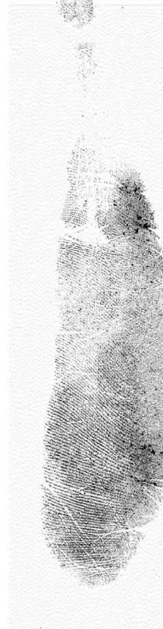
Euskuineko ertz hipotenarra Borde hipoternar derecho