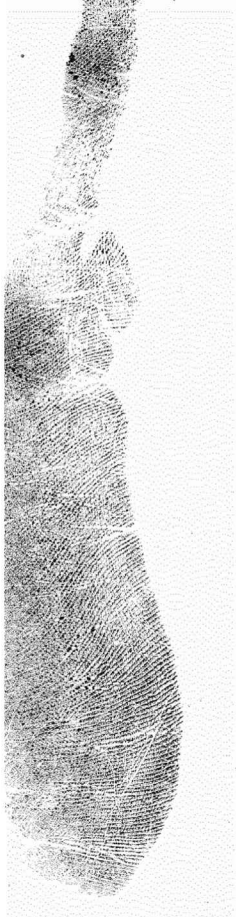
Ezkerreko ertz hipotenarra Borde hipoternar izquierdo